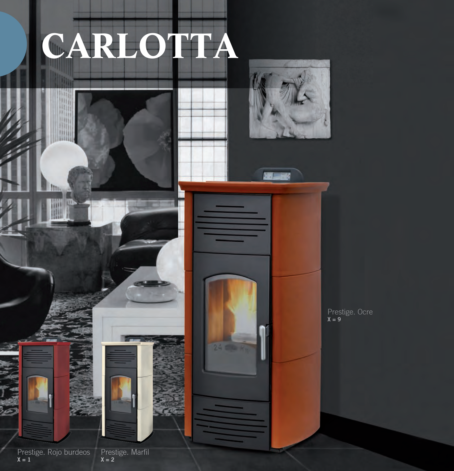
Prestige. Ocre X = 9