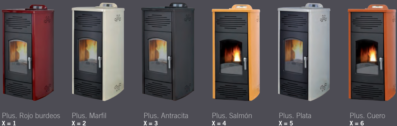
Plus. Rojo burdeos X = 1