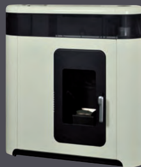
Marfil X = 2