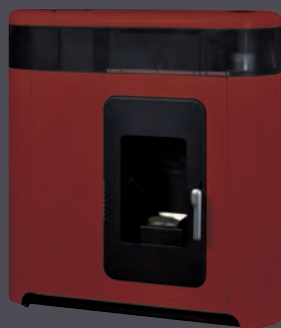
Rojo X = 1