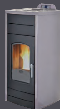
Plata X = 5