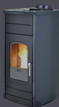
Antracita X = 3