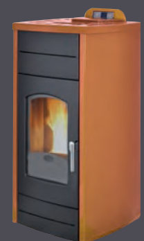
Cuero X = 6