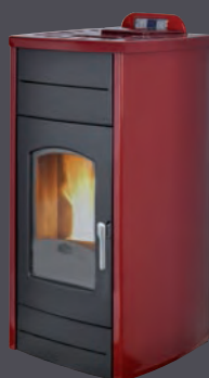
Rojo burdeos X = 1