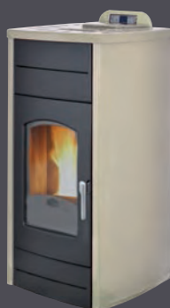
Marfil X = 2