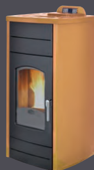
Salmón X = 4