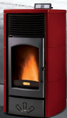
Deluxe. Rojo burdeos X = 1