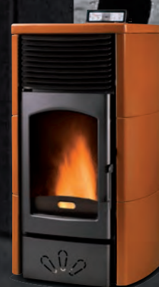
Deluxe. Ocre X = 9