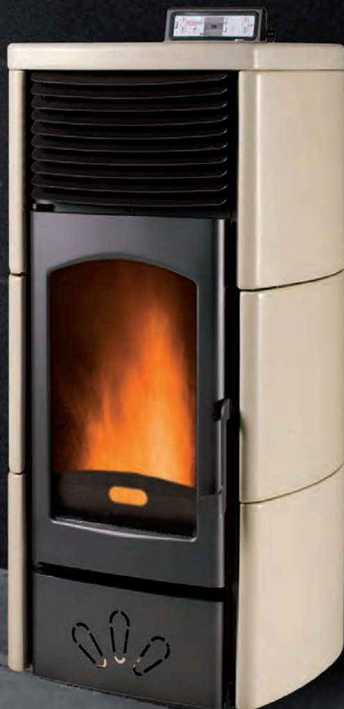
Deluxe. Marfil X = 2