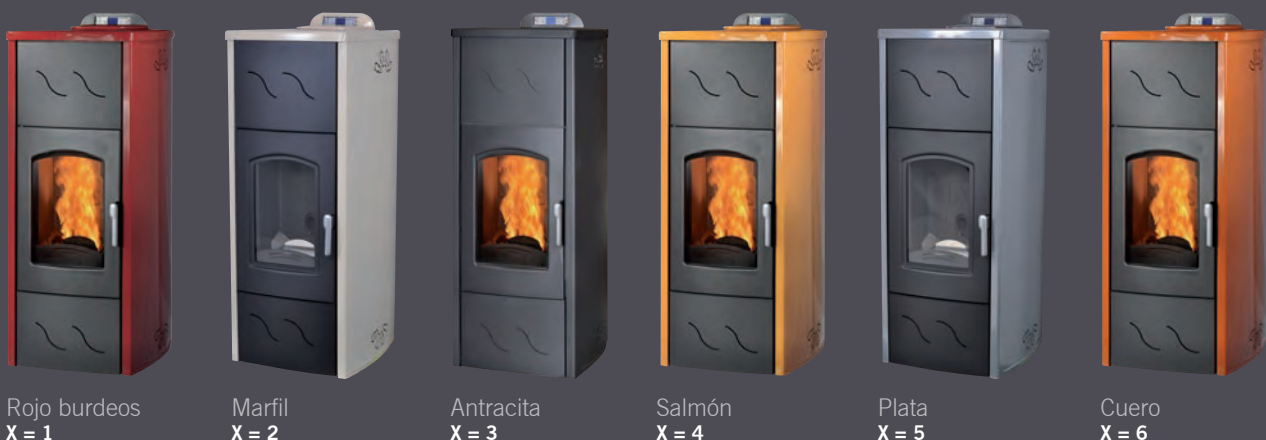
Rojo burdeos X = 1