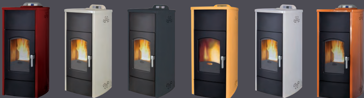
Plus. Rojo burdeos X = 1