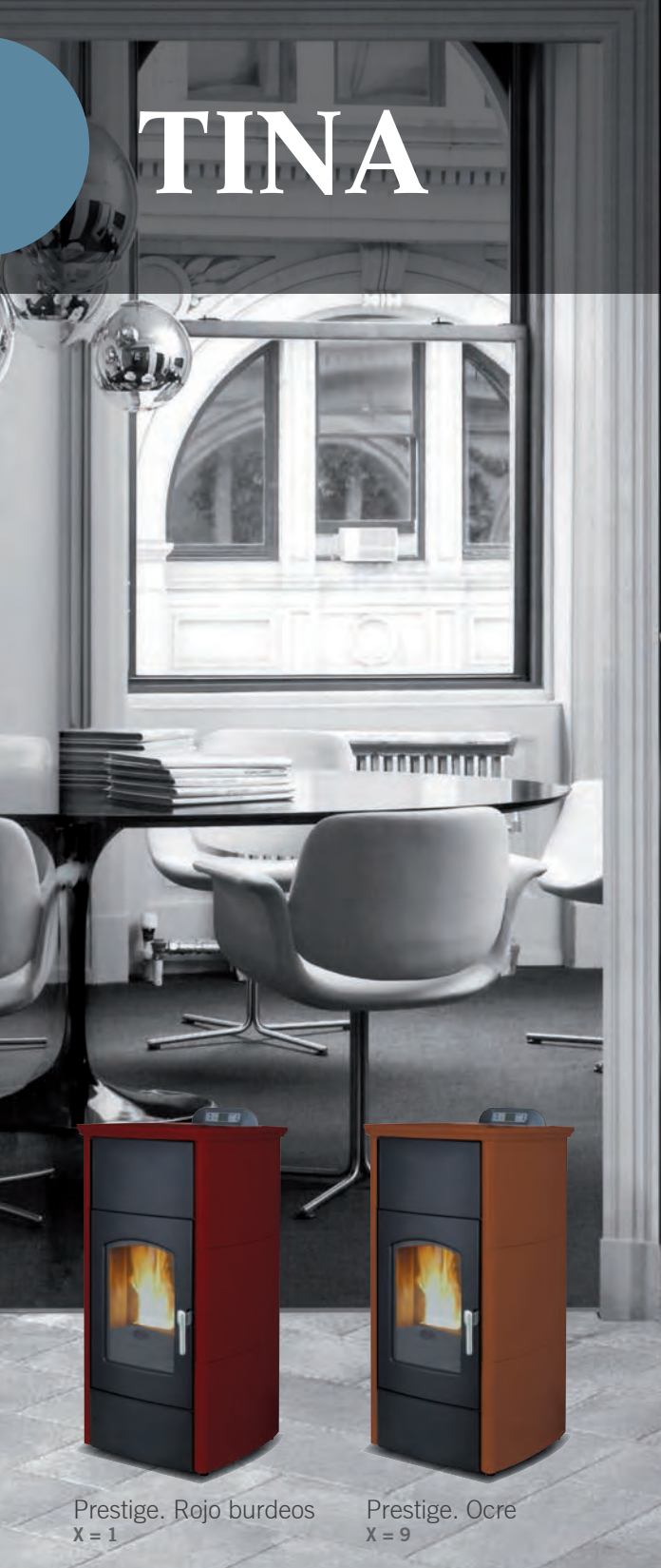
Prestige. Rojo burdeos X = 1