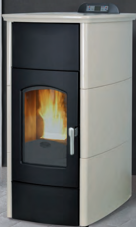
Prestige. Marfil X = 2