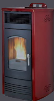
Plus. Rojo burdeos X = 1