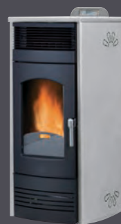
Plus. Inoxidable X = 5