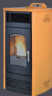
Plus. Salmón X = 4