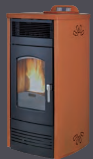
Plus. Cuero X = 6