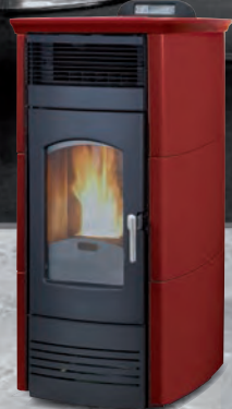
Prestige. Rojo burdeos X = 1