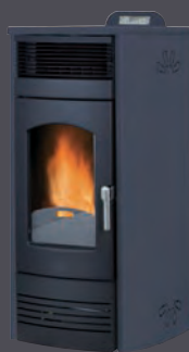
Plus. Antracita X = 3