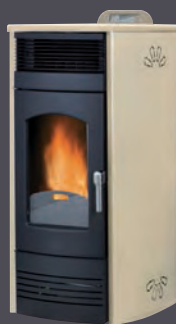
Plus. Marfil X = 2