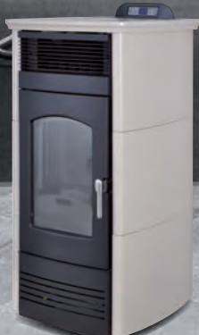
Prestige. Marfil X = 2