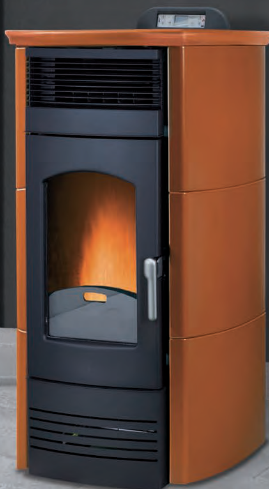
Prestige. Ocre X = 9