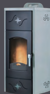
Plus. Plata X = 5