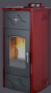
Plus. Rojo burdeos X = 1