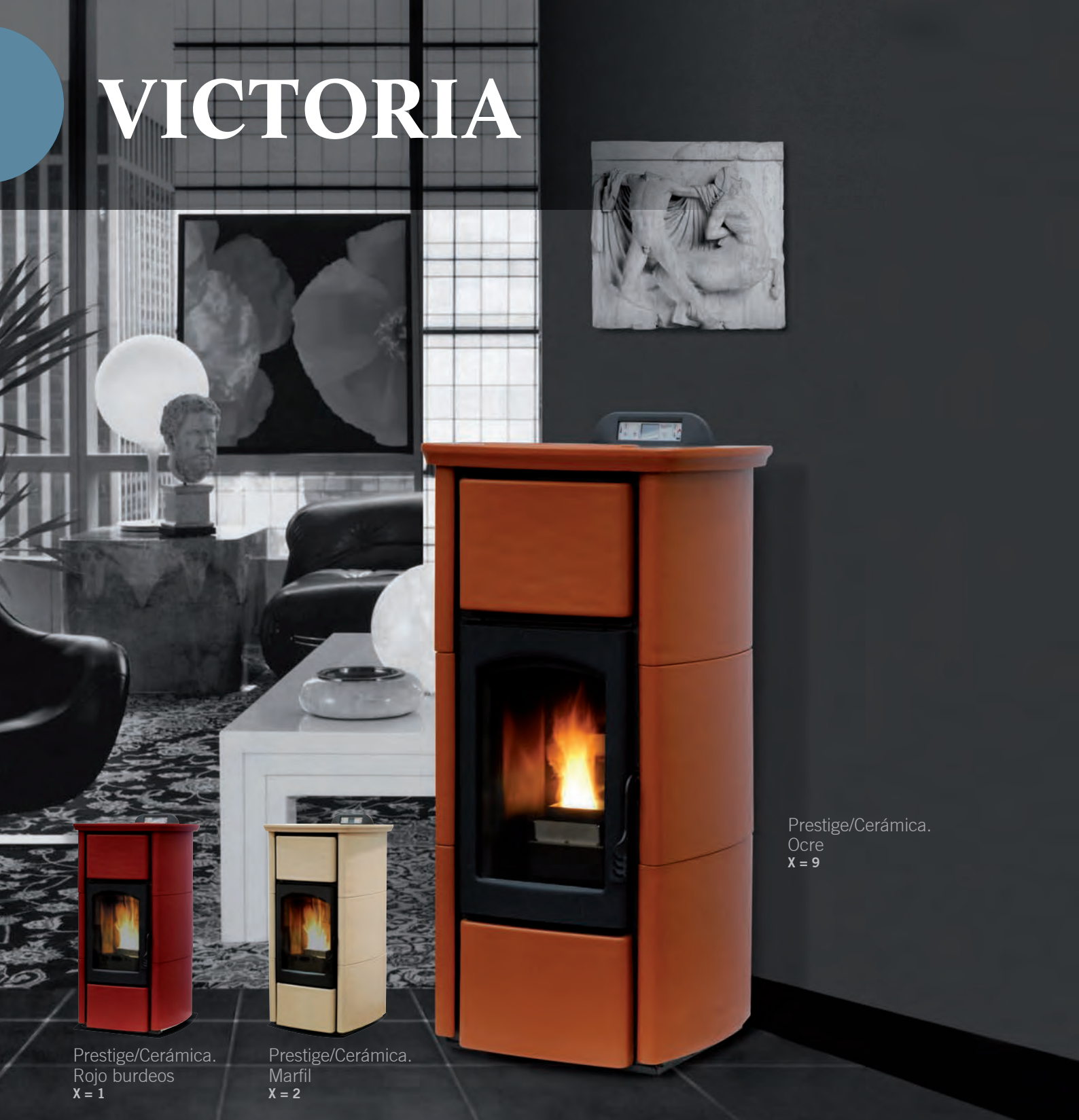
Prestige/Cerámica. Rojo burdeos X = 1