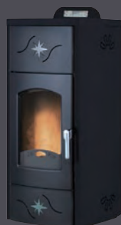
Plus. Antracita X = 3