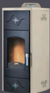
Plus. Marfil X = 2