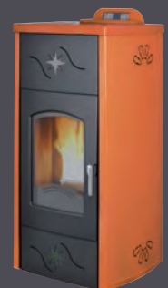
Plus. Cuero X = 6