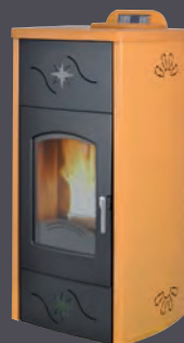
Plus. Salmón X = 4